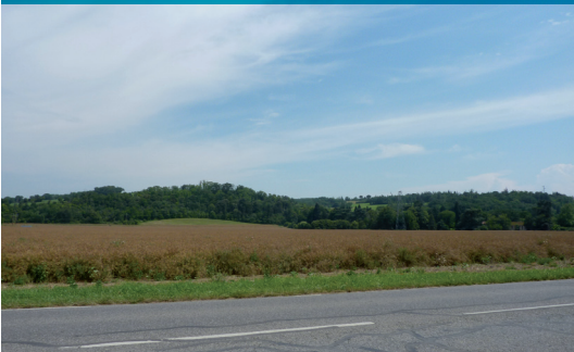
Coteaux d'Ariège et de Garonne

Un développement de l'urbain plus récent sous forme d'habitats individuels ou groupés offrent l'image d'un bâti souvent standardisé, peu structuré. Ces formes s'accompagnent d'une forte consommation d'espace et d'une multiplication de voiries, parfois mal raccordées au maillage existant.