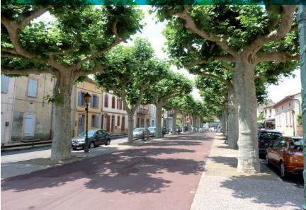
Allées du Baron ritay