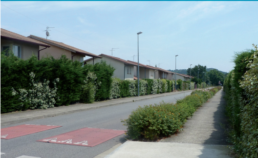
Bâti pavillonnaire standardisé

Tourné vers le fleuve, il représente un bel exemple de village garonnais. La place du village, la halle, le mail de platanes, les ruelles du centre ancien... forment un ensemble de qualité.