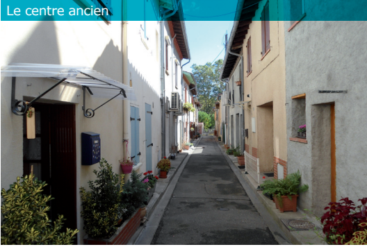
Le centre ancien