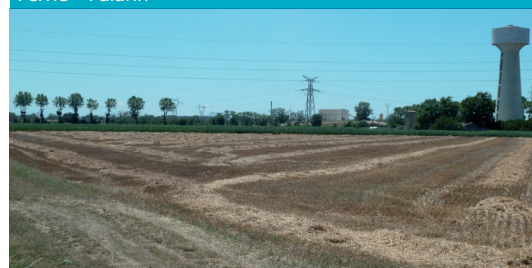
Ferrié - Palarin

Compris entre la RD 120 et l'A64, cet espace encore partiellement cultivé propose un paysage d'apparence rurale et très ouvert. Les haies et alignements de platanes le long des axes routiers secondaires viennent ponctuer et animer ce paysage agricole. L'urbanisation et les axes de communication (voie ferrée, RD 120) qui s'intensifient viennent toutefois peu à peu refermer cette perception paysagère et ces visions lointaines. Le paysage est également très impacté par la présence de très nombreuses lignes à haute tension.