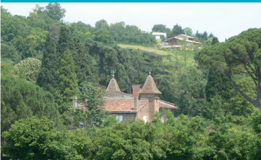
Château de la Creuse