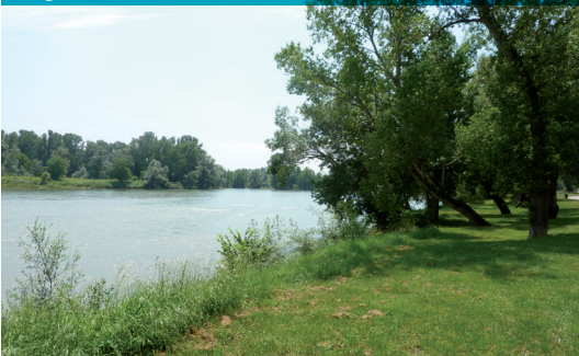
Berge Garonne Ramiers

« Pour les participants, les aménagements de qualité sont pointés, même si certains mériteraient d'être améliorés et mieux valorisés (accessibilité, entretien paysager)